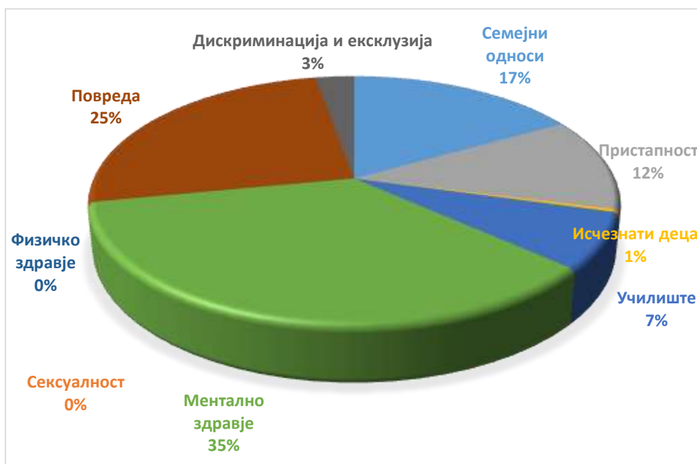
Табела 3: Број на деца и млади кои се регистрирани според категорија на проблем