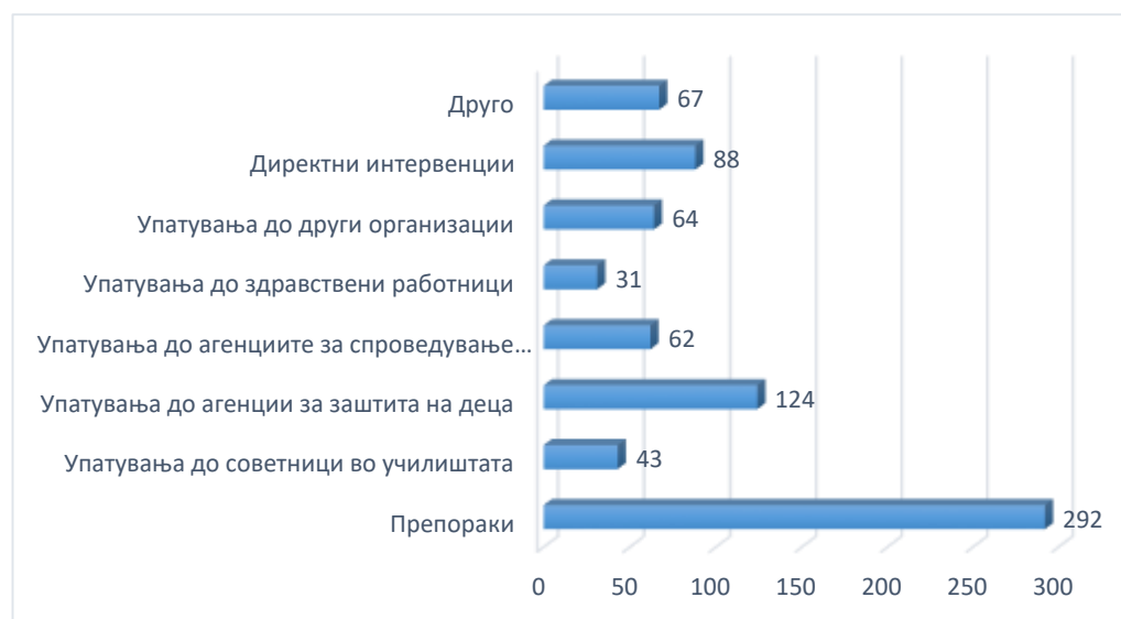
Графикон 5: Преземени активности

Во текот на постапувањето и давањето поддршка на децата, тимот на АлоБушавко-телефонот за деца и млади соработуваше со Центрите за социјална работа од Скопје и другите градови, Народниот правобранител, Секторот за внатрешни работи, училишта, Здружението на млади правници, Коалицијата за правично судење и други чинители и организации заради давање подобра и поефикасна поддршка на јавувачите. Во текот на оваа година продолжи блиската и успешна соработка со скопскиот центар за социјална работа и со нивниот Интервентен тим во повеќе наврати. Дојави што се однесуваа на насилство врз деца, родителска несоодветна грижа, непостапување според издадено решение за остварување контакт или средба со родителот по развод, се дел од успешните примери за кои заедно со Народниот правобранител успеавме да го подобриме остварувањето на правата на повеќе деца.