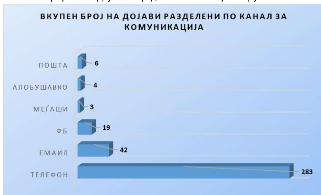
Графикон 2: Дојави според каналот на комуникација

* Пошта – дојави примени примени по пошта